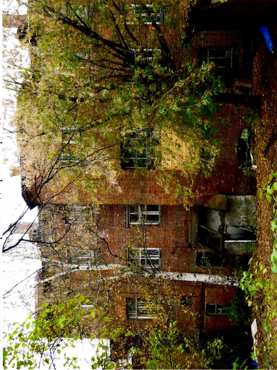
Фото № 3 от 16.10.2015. Фрагмент дворового фасада.