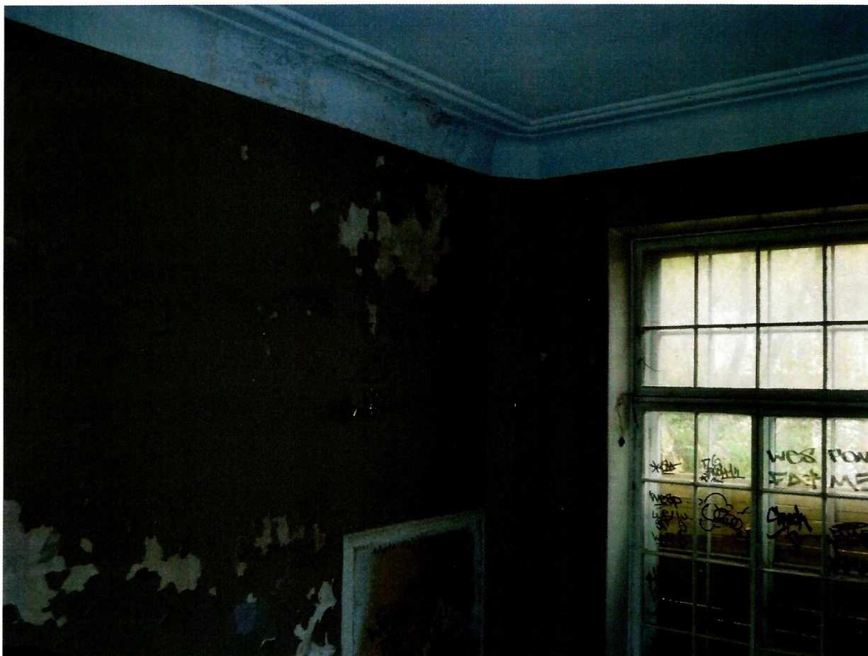
Фото № 4 от 16.10.2015. Внутреннее помещение.