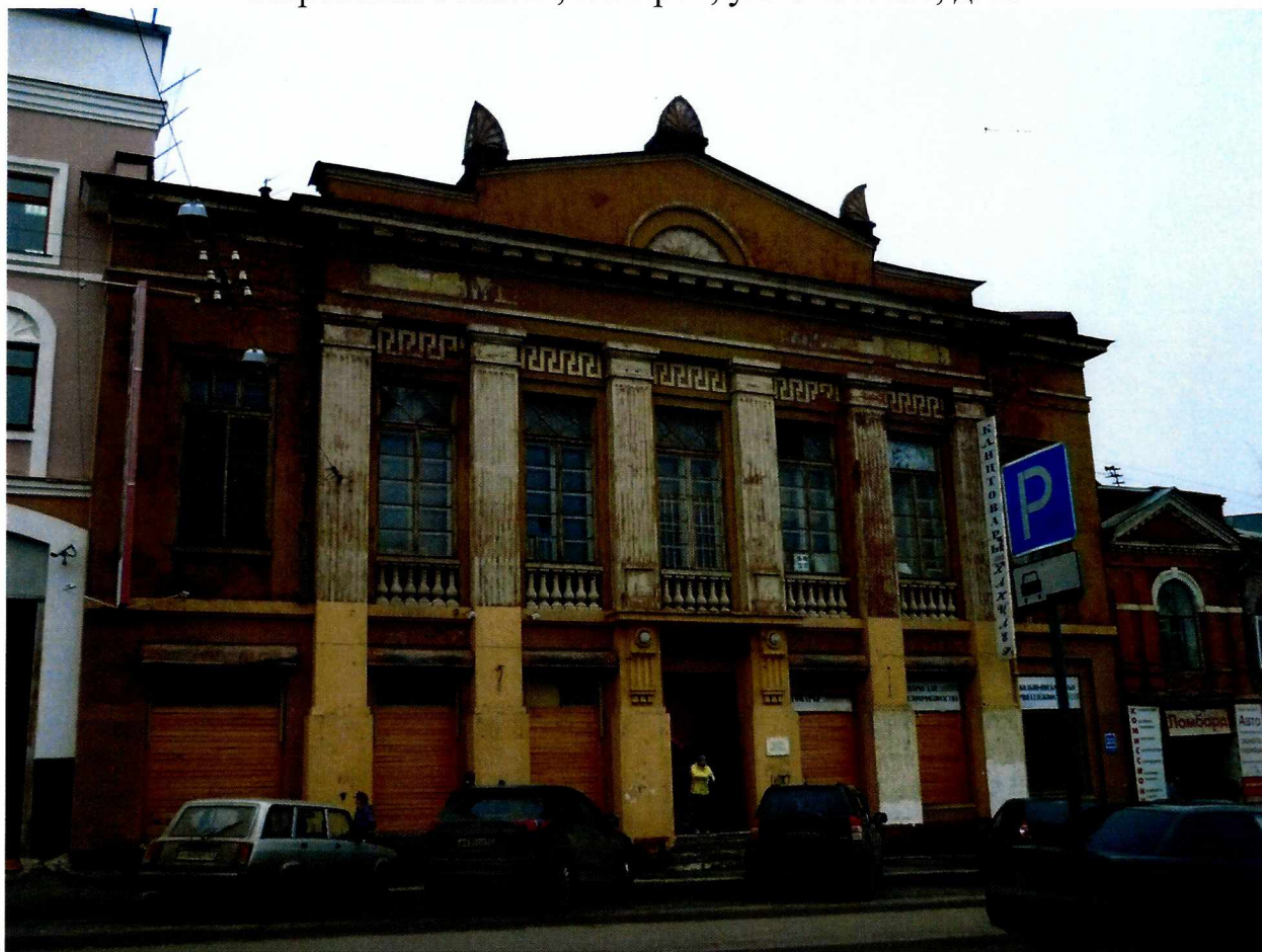
Фото № 1 от 16.10.2015. Главный уличный фасад.

объекта культурного наследия (памятника истории и культуры) народов Российской Федерации регионального значения «Здание, в котором находился Вятский горком комсомола», расположенного по адресу: Кировская область, г. Киров, ул. Спасская, д. 23