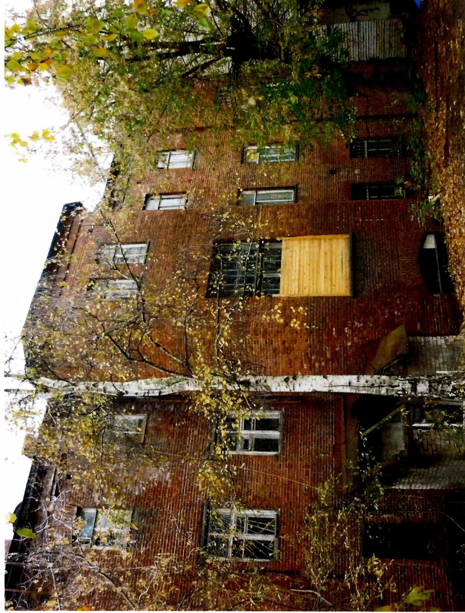
Фото № 2 от 16.10.2015. Фрагмент дворового фасада.