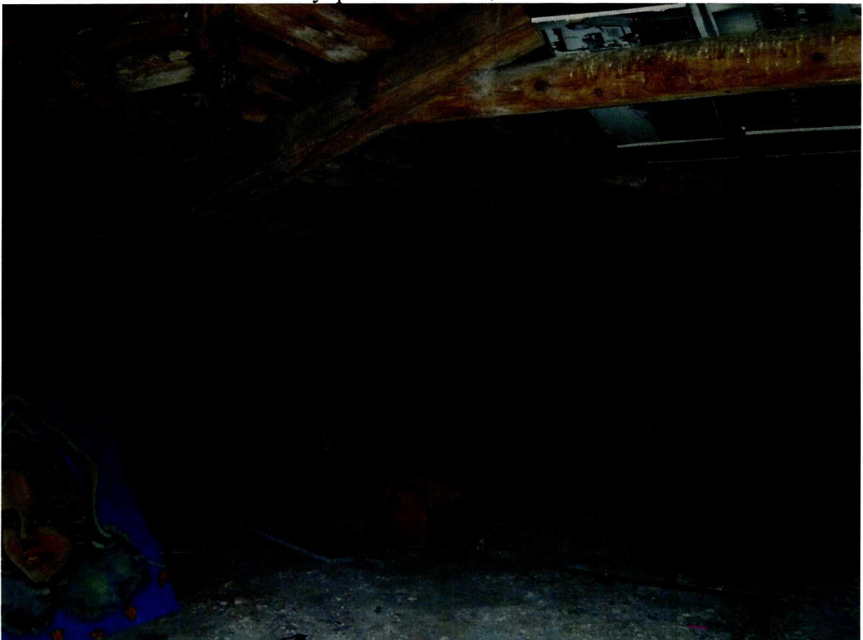
Фото № 7 от 16.10.2015. Чердачное помещение.