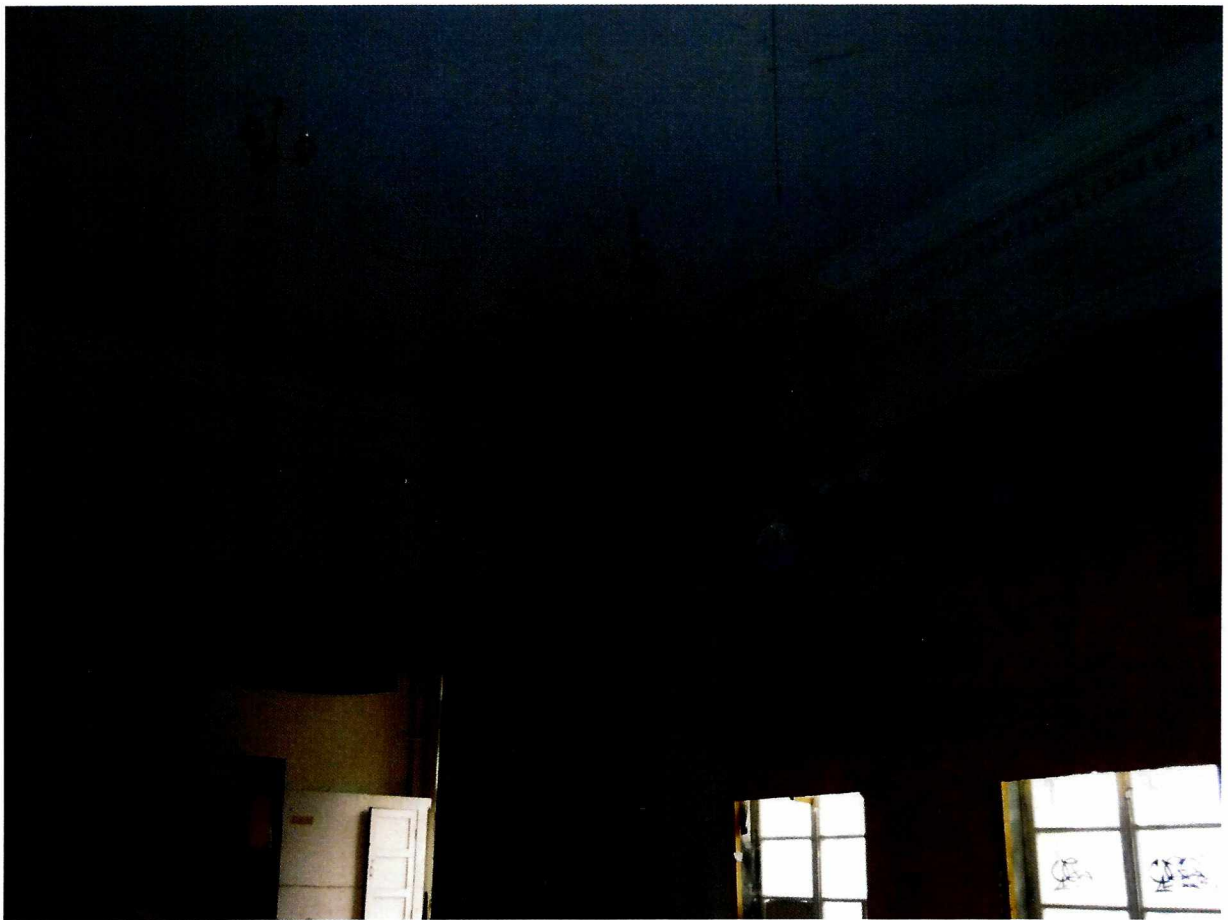
Фото № 6 от 16.10.2015. Внутреннее помещение.