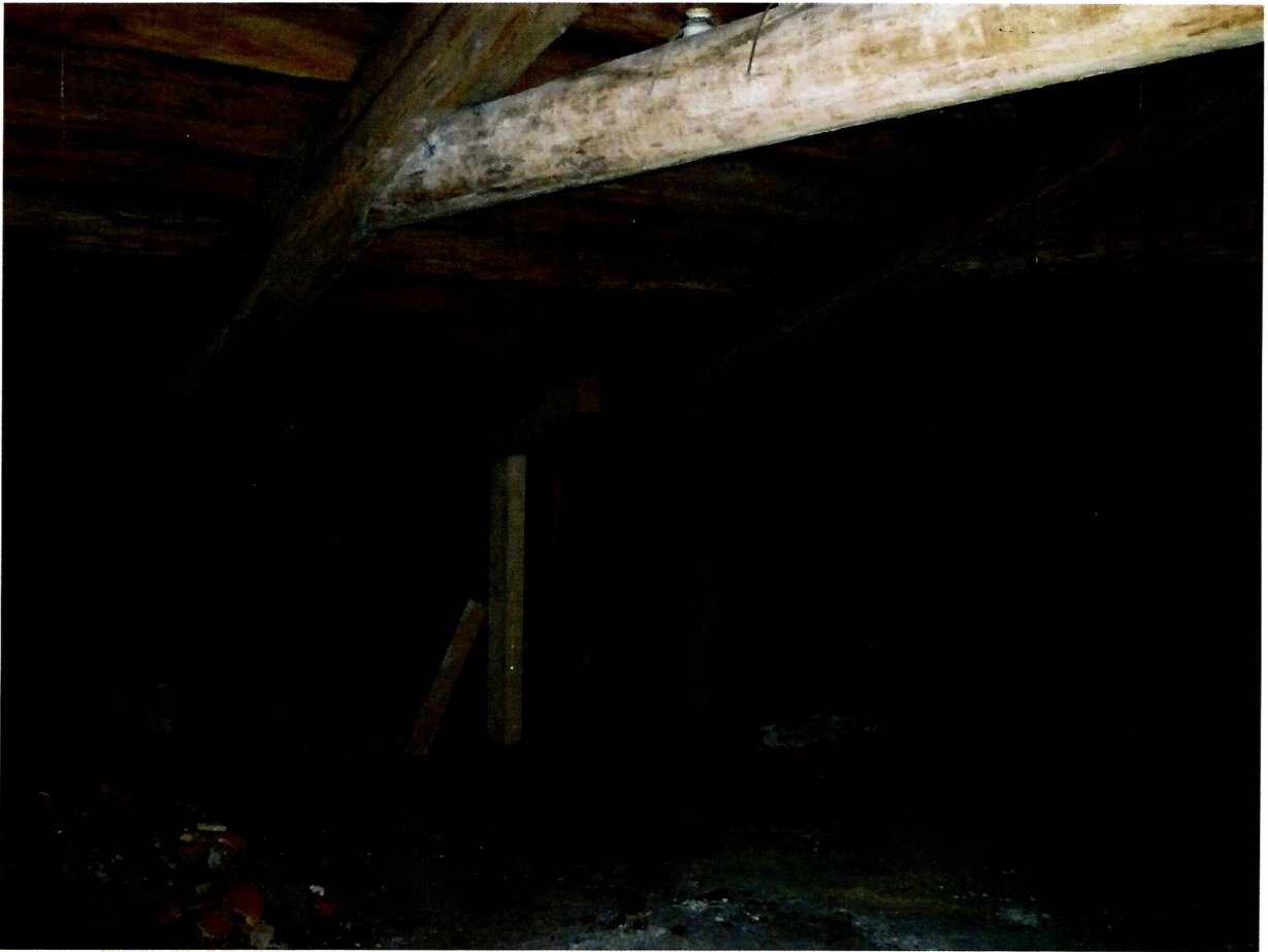
Фото № 8 от 16.10.2015. Чердачное помещение.